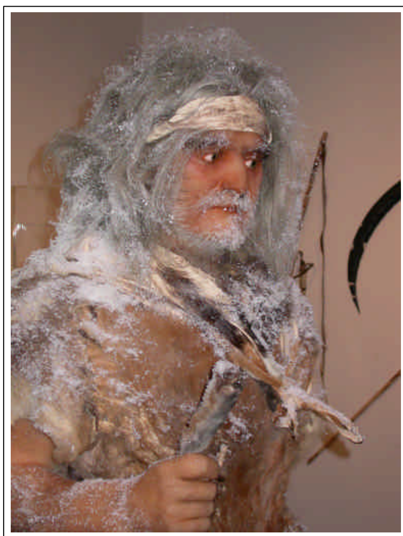
De jager uit de steentijd

De tentoonstelling werd samengesteld door de dienst Cultureel erfgoed van de provincie Antwerpen. Het Stedelijk museum zorgde voor een educatieve omkadering. Voor scholen is een speciaal “doe-pakket” samengesteld. Leerlingen jagen zoals in de prehistorie, worden gekleed met huiden of zoals de eerste landbouwers, spinnen wol of lijmen scherven. Het boek “Verloren voorwerpen” begeleidt de tentoonstelling en is te koop aan €25 in het Stedelijk museum.