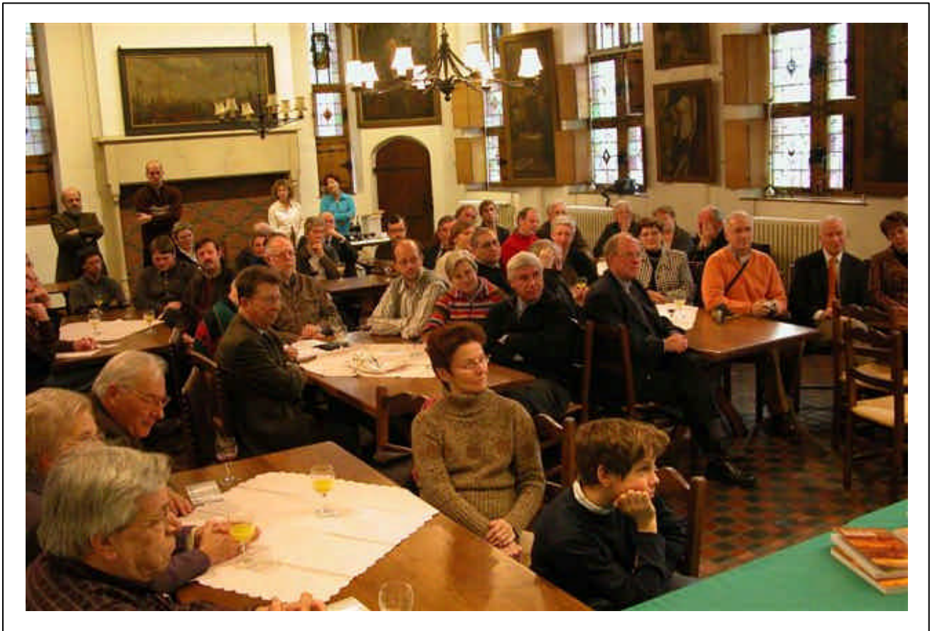
De raadzaal zat vol voor de presentatie van ons eerste erfgoedboek !

Kring en "de Oranjeboom". Sinds 1948, het jaar van oprichting van "de Oranjeboom", bewaarde het Bredase archief de publicaties van de Hoogstraatse zustervereniging, die reeds in 1933 was gevormd.