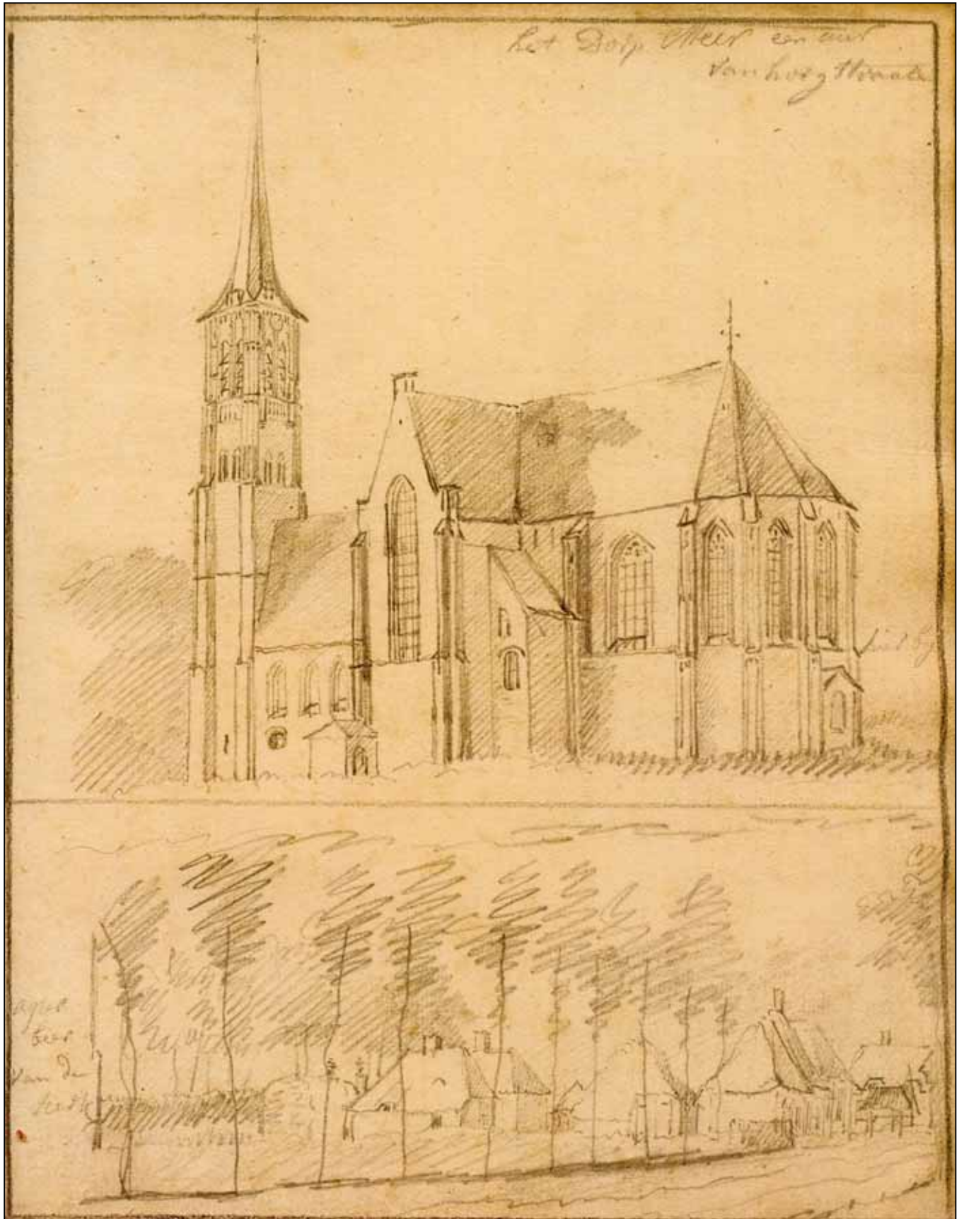
De kerk van Meer en Meerdorp