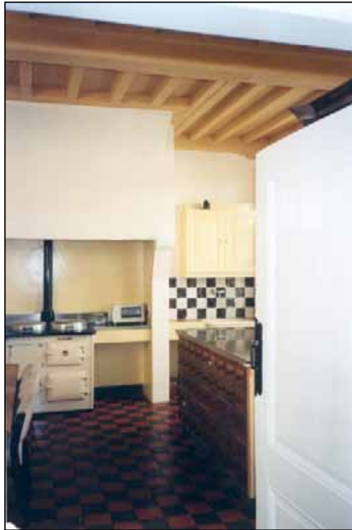
Openraamdag in het begijnhof van Hoogstraten

het protestantse noorden, voornamelijk uit Noord-Brabant. Interieurs bekijken en verhalen beluisteren over vrome en minder vrome begijnen lijkt een boeiende combinatie.